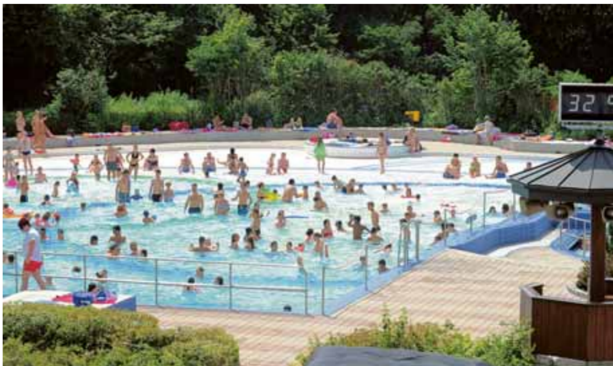
Sie gehört im Sommer zu den Hauptattraktionen in Gersthofen: die Gerfriedswelle. Doch das Freibad altert und muss saniert werden. Ein Arbeitskreis berät über die Zukunft der Gerfriedswelle und des Hallenbades.

Beleuchtet hatte die Studie auch einen Neubau des Hallenbads am Standort des Freibads mit Reduzierung des Angebots im Freien. Letzte Variante war der Neubau von Hallenbad und Freibad an einem neuen Standort, „auf der grünen Wiese“. Bis heute hat der Stadtrat noch nicht endgültig entschieden. Bislang wurde allerdings besonders über ein Ganzjahresbad an der Sportallee nachgedacht. (khw, lig)